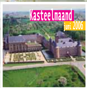
TOERISME BILZEN tel. 089- 51 56 54