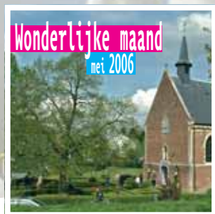
TOERISME SINT-TRUIDEN tel. 011- 70 18 18